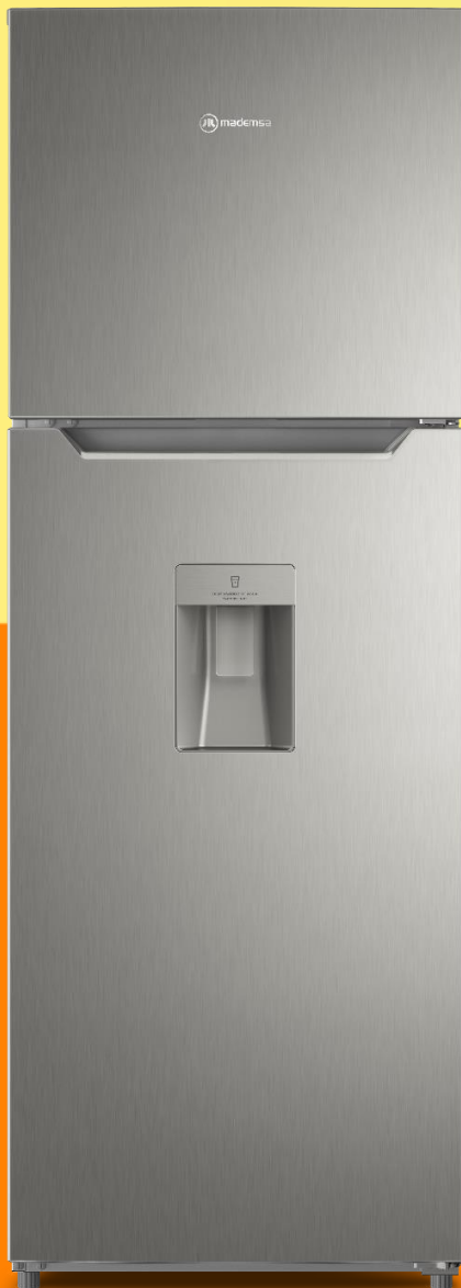
REFRIGERADOR NO FROST ALTUS 1350W